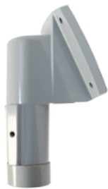
PUNTA DE POSTE 25° CON ADAPTADOR ROSCADO HZCAS25SUPPORT