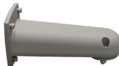
BRAZO PARA MURO HZCASMARM