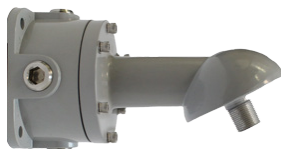
BRAZO A MURO A 25° HZCAS25ARMJBOX