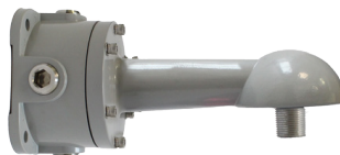
BRAZO PARA MURO A 90° HZCAS90ARMJBOX